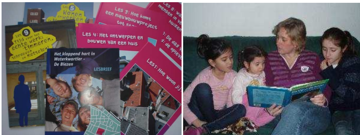
Voorbeelden van samenwerking; lessen over de wijk en de Voorleesexpress

Veel scholen en buurtorganisaties hebben elkaar al gevonden. Zo kennen we lesbrieven over wijkvernieuwing, wijkwebsites met een kinderredactie, voorleesexpressen en cursussen voor ouders op school. Allemaal prachtige initiatieven. Maar werken ze ook? Is er 'hard evidence' voor de meerwaarde van samenwerking? En valt uit de samenwerking meer wederzijds voordeel te halen, zodat het voor iedereen leuker wordt?