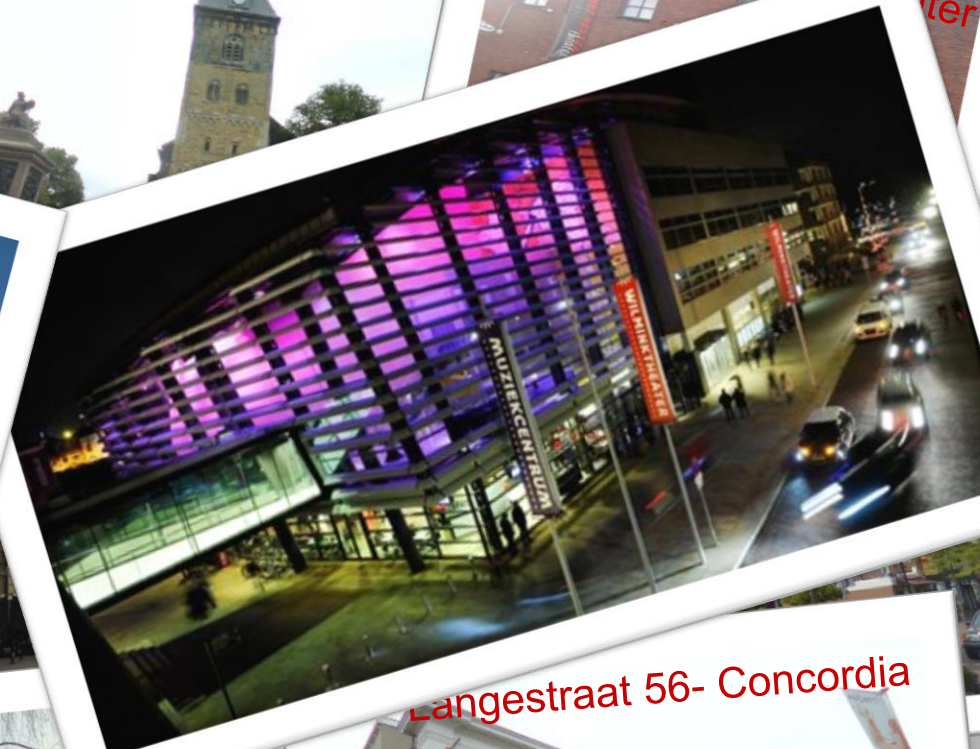
Langestraat 56- Concordia